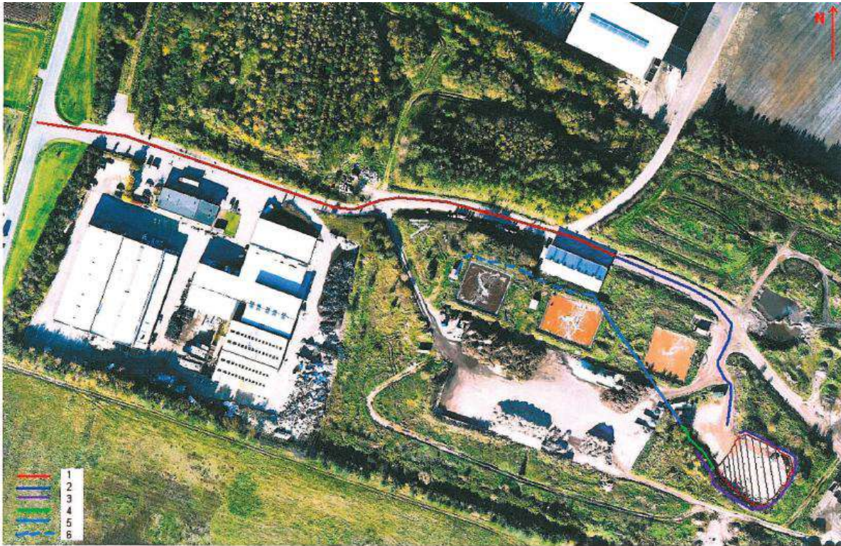
Figur 2: Kørevej og afledning af overfladevand.