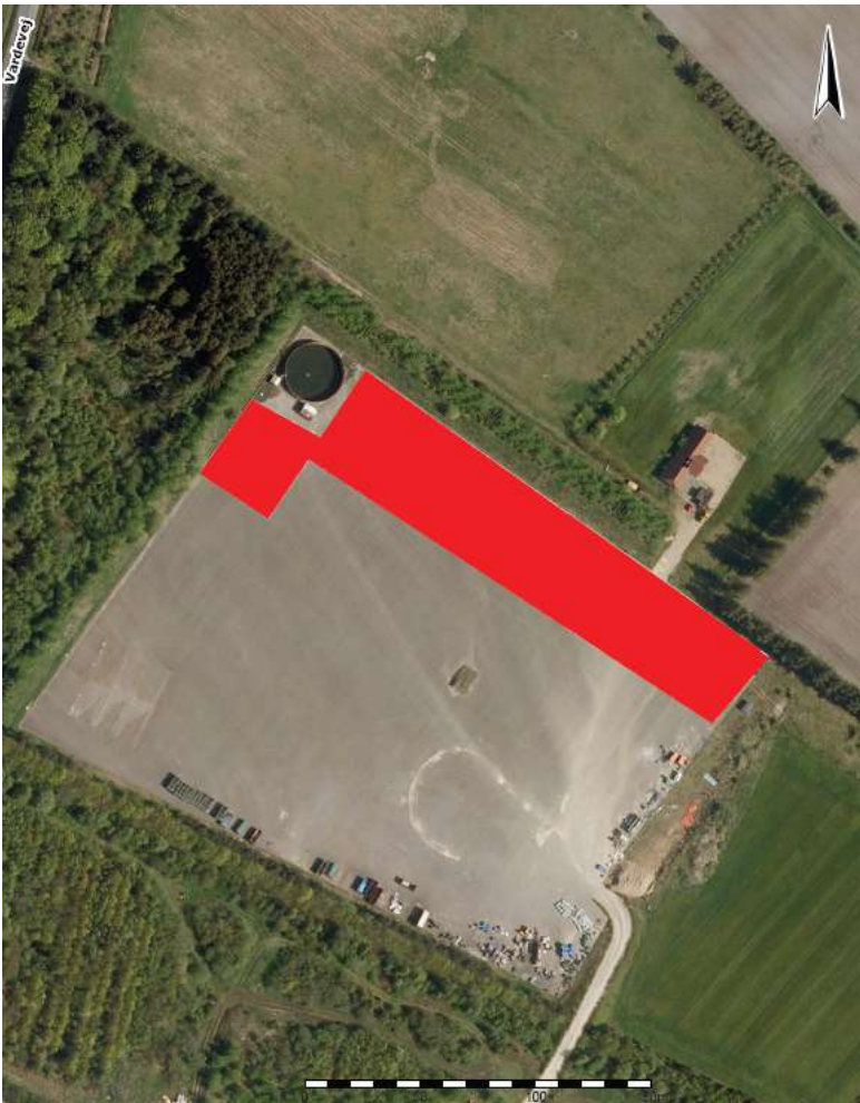
Figur 3 (identisk med figur 1): Rødt område, er ca. det område, som miljøgodkendes til oplagring af ikke-farligt brændbart affald i baller. Det resterende der ses på fotoet er hele den asfalterede plads.